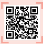
CJ 제일제당 직무소개