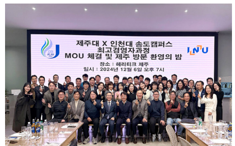
인천대-제주대 최고경영자과정 MOU체결(2024.12)