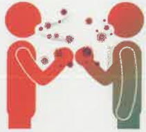
Fist bump X 주먹악수