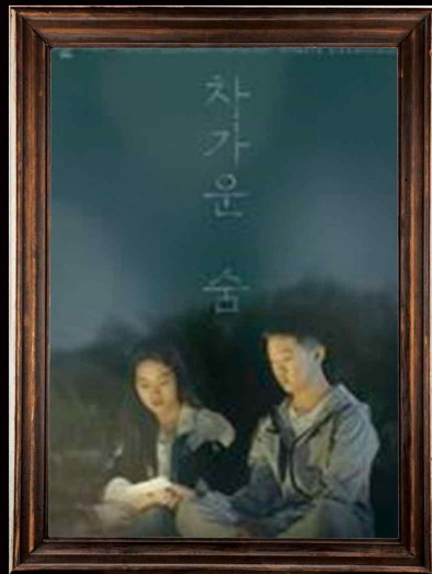
차가운 숨 (2023) The Cold Breath