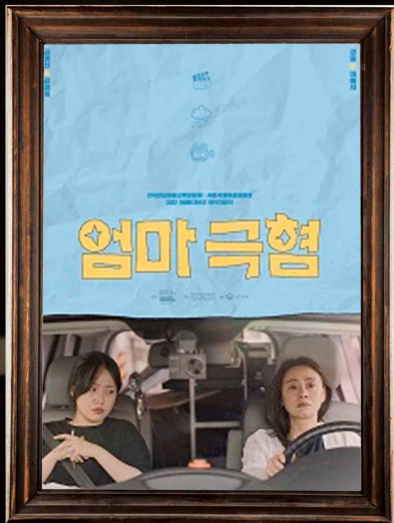
엄마극혐 (2022) My Annoying Mather