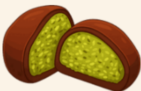
Dubai Chewy Cookies