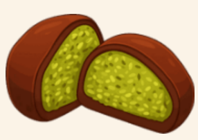
두바이 꿀득 쿠키