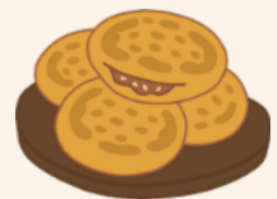
Sticky Honey Bread